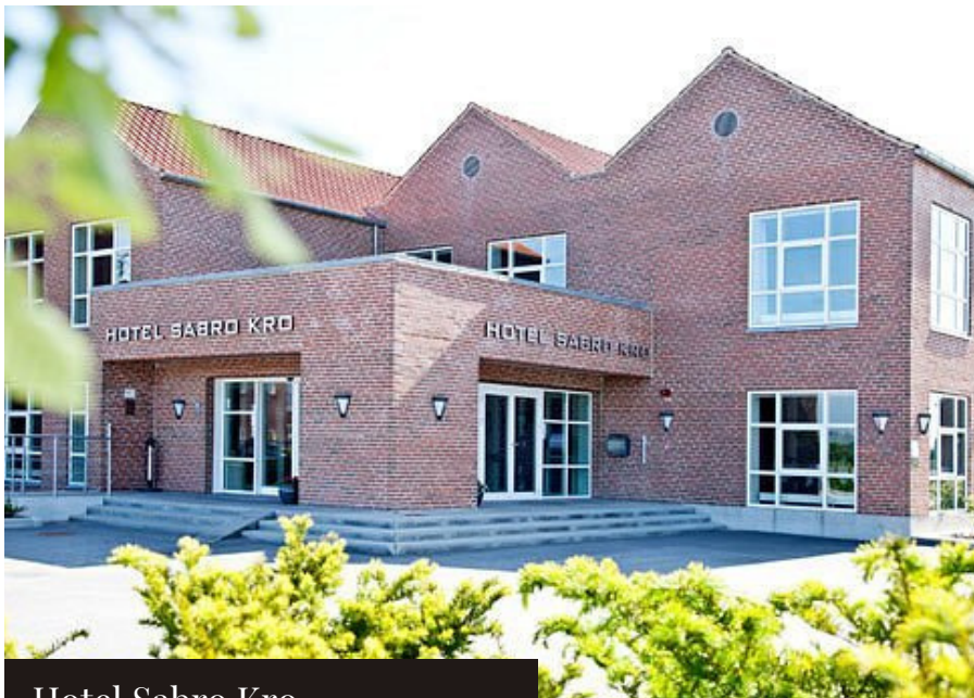
Hotel Sabro Kro

Skal du overnatte på hotellet, har vi forhåndsreserveret 12 værelser, så der er plads til alle vores kursister. Oplys blot, at du skal hører til GPower, når du bestiller, og du vil opnå vores rabat.